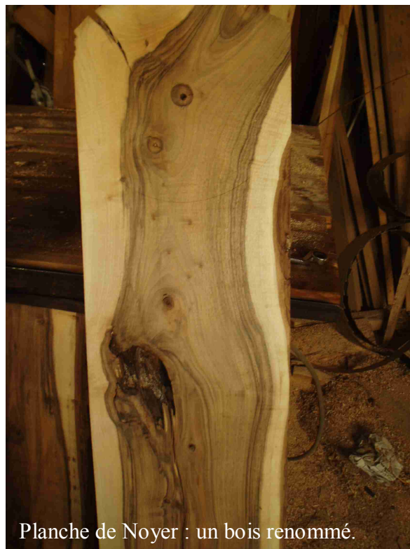
Planche de Noyer : un bois renommé.

Ses veinages exceptionnels, ses colorations, ses qualités physiques remarquables en ébénisterie, menuiserie, tranchage, en font un produit de luxe et, par définition, un feuillu précieux .