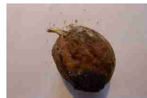
Germination de noix

Aussitôt après récolte (ne pas faire sécher les noix plus de 10 jours sinon le germe est détruit), mettre les noix dans un mélange de sable et de terre et les mettre au frais dans un terrain ressuyé (ex : dans un pot de terre et de sable enterré au jardin potager à 20 cm de profond minimum et grillagé pour le protéger des rongeurs. Attention à ne pas les stratifier dans un pot qui reste hors du sol car les gelées seraient trop intenses). Mettre les noix en place en milieu d'hiver (germination en février). Mettre 3-4 noix par trou à 3-4 cm de profond. Supprimer la concurrence herbacée, arroser régulièrement. Au bout de 2 ans, conserver la plus belle tige.